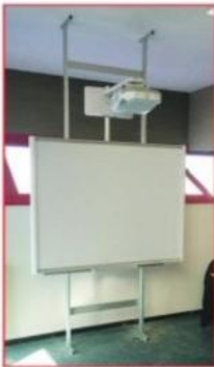
Versione con ancoraggio a pavimento e soffitto