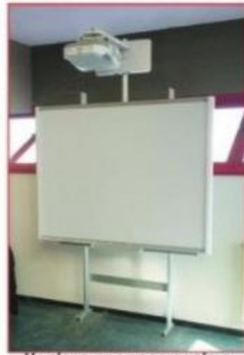
Versione con ancoraggio a pavimento e parete