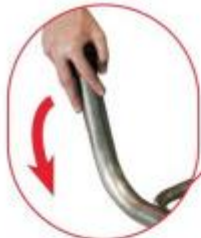
Lo spostamento è facilitato dalle ruote del sistema Sicur-Stop.