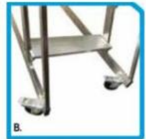
Ruote piroettanti con freno