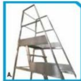
Particolare doppio pianerottolo