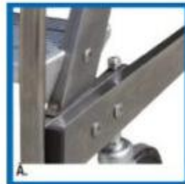
Particolare attacco gradino