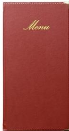
Portamenu' in semipelle per ristorante h148115