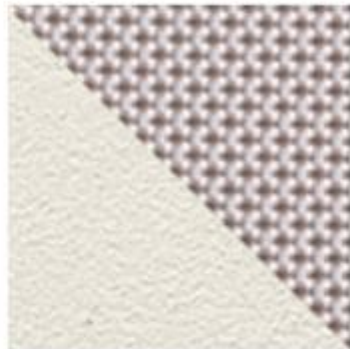
Metallo/23 Emutex/300/42 BIANCO + JERSEY