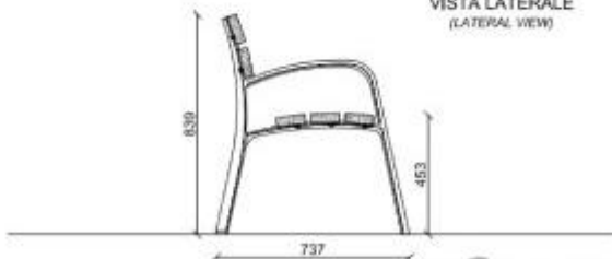
VISTA LATERALE (LATERAL VIEW)

Tipologia panchine arredo urbano: con schienale Profondità in millimetri: 737 mm Larghezza in millimetri: 1900 mm Altezza in millimetri: 839 mm Materiale: legno