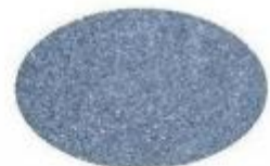
Tipo Pietra Lavica