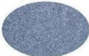
Tipo Pietra Lavica