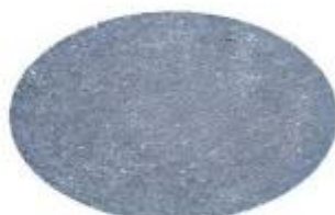
Tipo Pietra Lavica