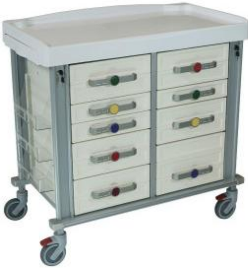
Colori disponibili per cassettei