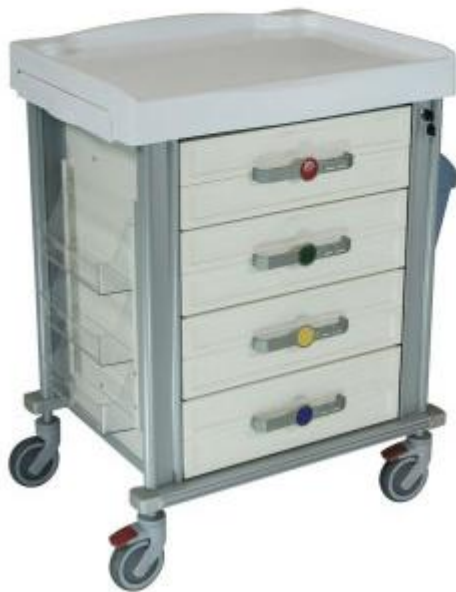
Colori disponibili per cassetti