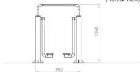
VISTA LATERALE (Frontal View)

Air walker per aree fitness esterne h575_102